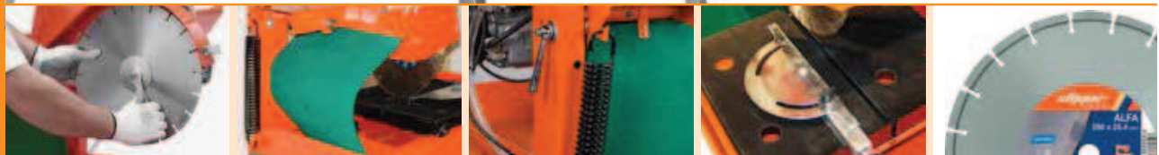
Простота замены диска