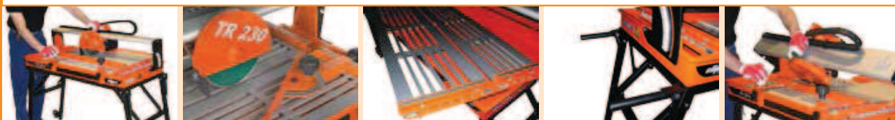
Направляющая резки с угловой установкой

TR230GS - это профессиональный плиткорез с мощным мотором (1.1 кВт) и длиной стола, адаптированный под плитку больших размеров (860 мм).